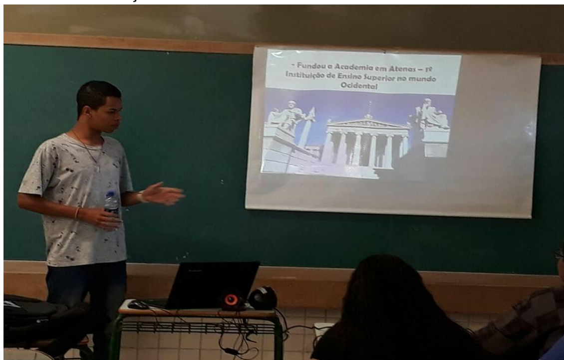
Foto de uma Intervenção realizada no dia 19/09/2017 das 7:30 às 9:10 no 1 ano do Colégio Estadual Ayrton Senna da Silva. Sobre a vida e obras de Platão e posteriormente apresentar o Mito da Caverna ressaltando a importância do

Uma das preocupações dos coordenadores era de que durante o ano de participação no PIBID fosse aplicada no mínimo 3 intervenções. Todas as intervenções foram muito importantes para o meu aprendizado e desenvolvimento. Apreendi como elaborar um plano de aula e aplicar de forma eficiente, assim me preparando ainda mais para meu futuro na docência. Foram no total 6 intervenções durante 2016 e 2017.